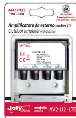
Imballo 18 x 19 x 6 cm Confezione 24 pz.