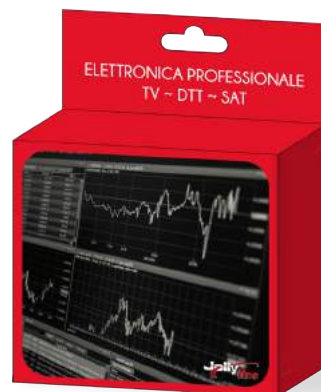
Imballo 14 x 12 x 5 cm Confezione 25 pz.