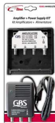
Imballo 13 x 30 x 6 cm Confezione 20 pz.