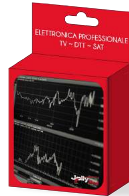
Imballo 10 x 12 x 6 cm Confezione 25 pz.