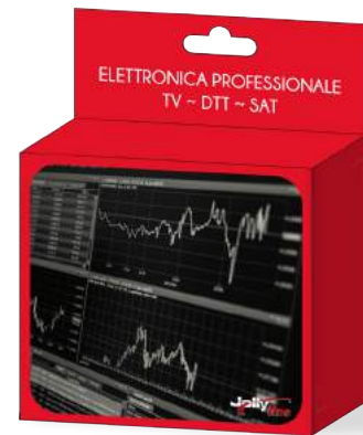
Imballo 14 x 12 x 5 cm Confezione 25 pz.