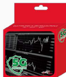
Imballo 13 x 14 x 5 cm