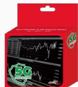
Imballo 13 x 14 x 5 cm