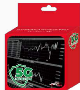
Imballo 13 x 14 x 5 cm