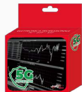
Imballo 13 x 14 x 5 cm