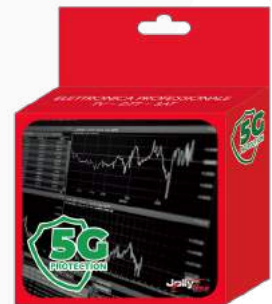
Imballo 13 x 14 x 5 cm